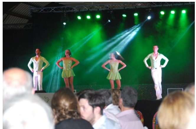
La troupe de cabaret « Y'a d'la joie »