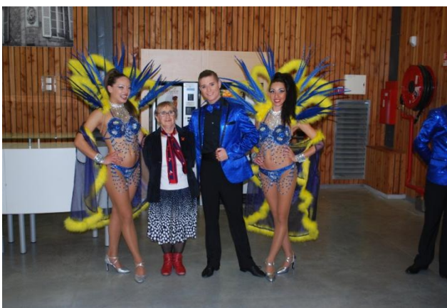
Photo de gauche avec une partie de la troupe Photo de droite, costume réalisé par « L'Atelier »