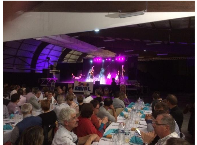
Pendant le spectacle