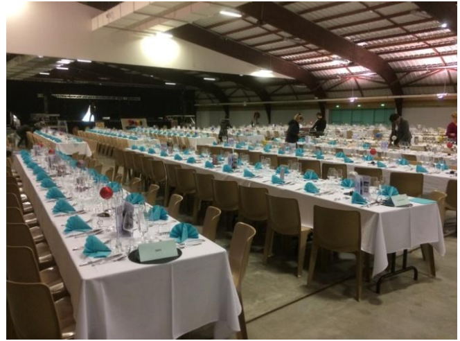
La salle avant le spectacle

Merci à l'ensemble des convives, qui, par leur présence ont montré l'intérêt qu'ils portent à notre association.